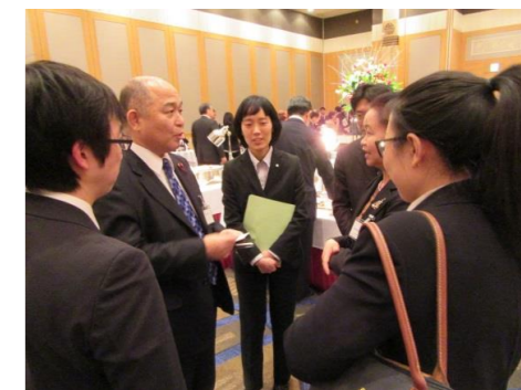
【ラオス人民民主共和国大使館】 ソムサヌック・ウォンサク 臨時代理大使