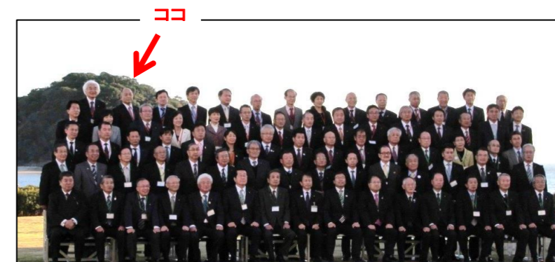
愛知県 正・副議長の皆さんと記念撮影