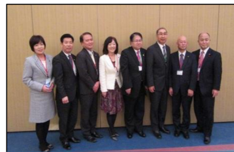
公明党議長・副議長8名参加

2月3日、蒲郡市にて愛知県市議会議長会定期総会が行われました。総会では各市からいろいろな議案が提出されました。また意見交換会もあり、有意義な会合となりました。