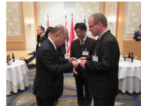
【名古屋アメリカ領事館】 スティーブン・G・コバチーチ 首席領事