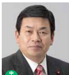
中川区 財務委員長