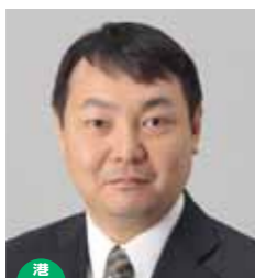
港区 副財務委員長