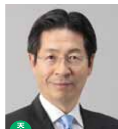
天白区 市会副議長