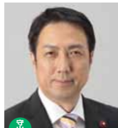
守山区 副政審会長 (広報委員長)