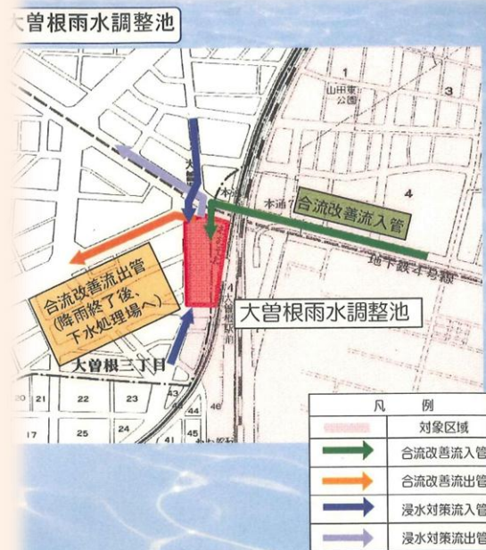
大曾根雨水調整池のイメージ図