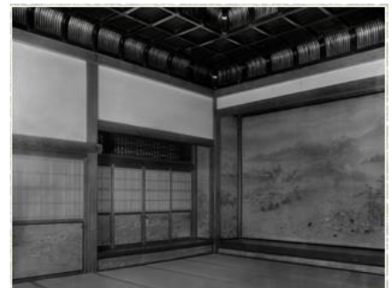
▲戦災焼失前の対面所上段之間(南西側)